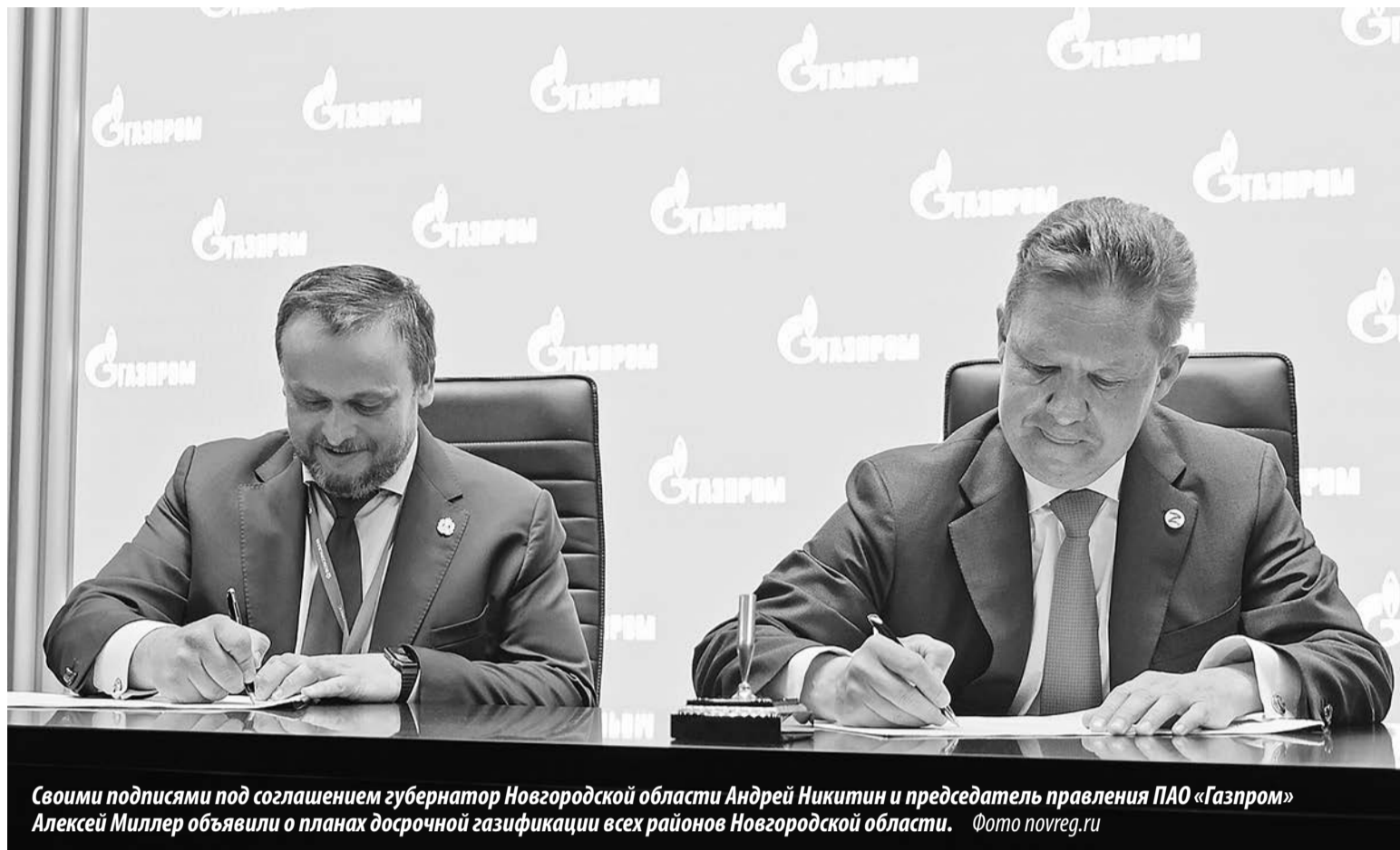
Своими подписями под соглашением губернатор Новгородской области Андрей Никитин и председатель правления ПАО «Газпром» Алексей Миллер объявили о планах досрочной газификации всех районов Новгородской области.